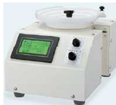
種子計数機 (植物種子等を自動計数する)