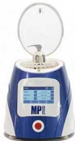
ビーズ破砕機 (微生物・組織等を冷却破砕する)