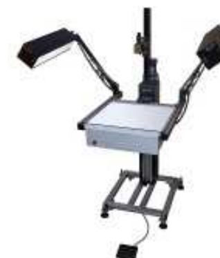
標本撮影装置 (解析用デジタル画像を撮影する)