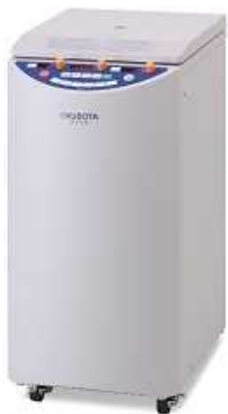
マイクロ冷却遠心機 (試料等を冷却遠心分離する)

8, 843千円 (新型コロナウイルス感染症対応地方創生臨時交付金活用予定) (備品購入費)